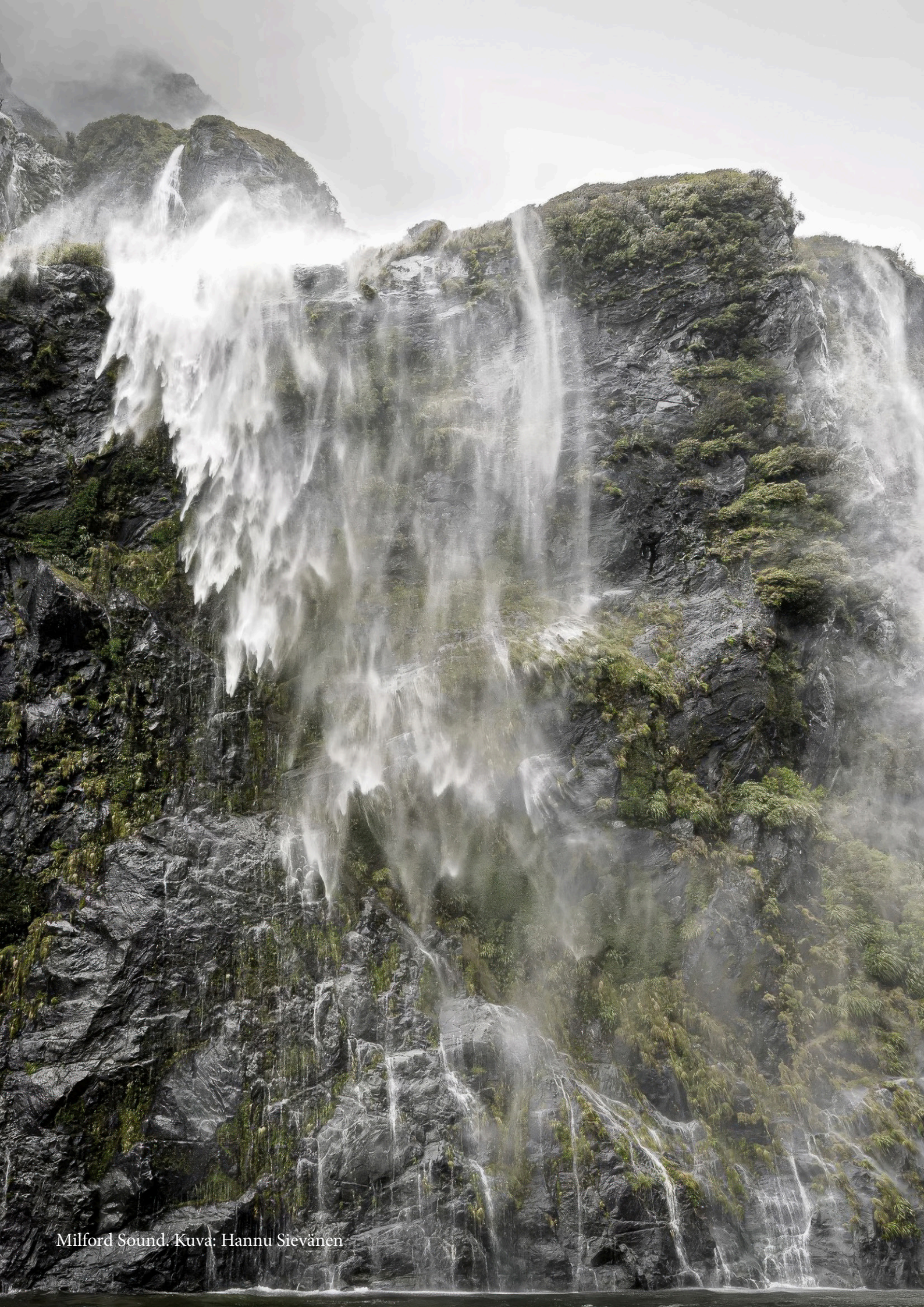
Milford Sound.